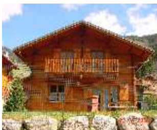
2 La Chanterelle