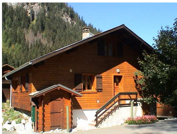
1 Chez l'Tonton