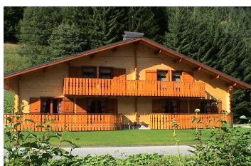
5 Le Grand Chalet